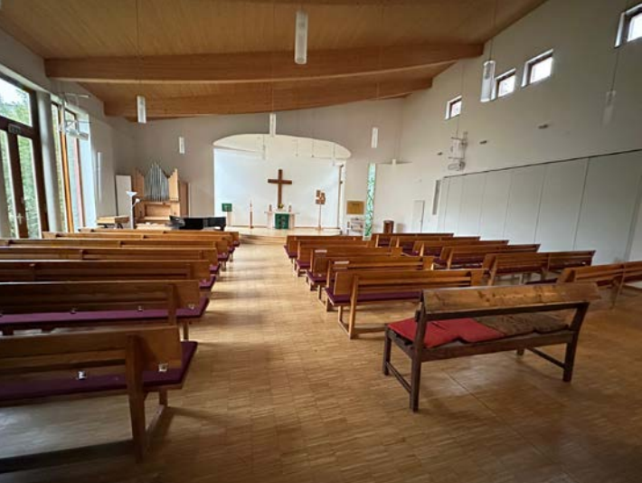
Der zentrale Kirchraum im Gemeindezentrum Weberalle 27

Die Kirchengemeinde Heilig Geist hat derzeit ca. 2.200 Glieder und ist damit die größte der vier evangelischen Kirchengemeinden in Falkensee und im neuen Kirchenkreis Havelland die zweitgrößte Gemeinde. Aktuell ist Pfarrerin Deml für Sie da. Direkt neben dem Gemeindezentrum in der Weberallee im ebenfalls neu gebauten Pfarrhaus wohnt eine Familie, da die Pfarrerin eine eigenen Wohnung in Falkensee bewohnt.