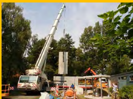
Setzen der ersten Wandscheibe