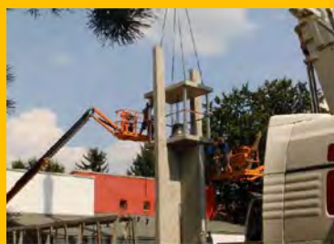
Einbau der Glockenstube