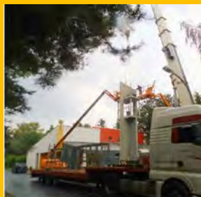
Setzen des „Schlussteines“