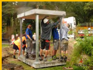
Montage des Gerüsts für die Glockenstube