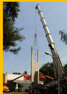
Einfädeln der zweiten Wandscheibe