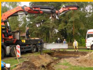
Einbringen des Betonfertigteilfundaments